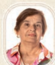
Rita Moreno Santiago