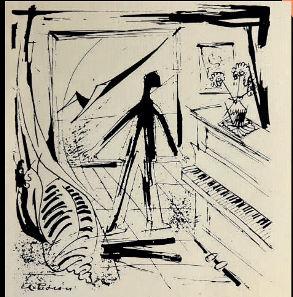
CARTEL HISTÓRICO DEL CONCURSO DE ANTONIO PADRÓN