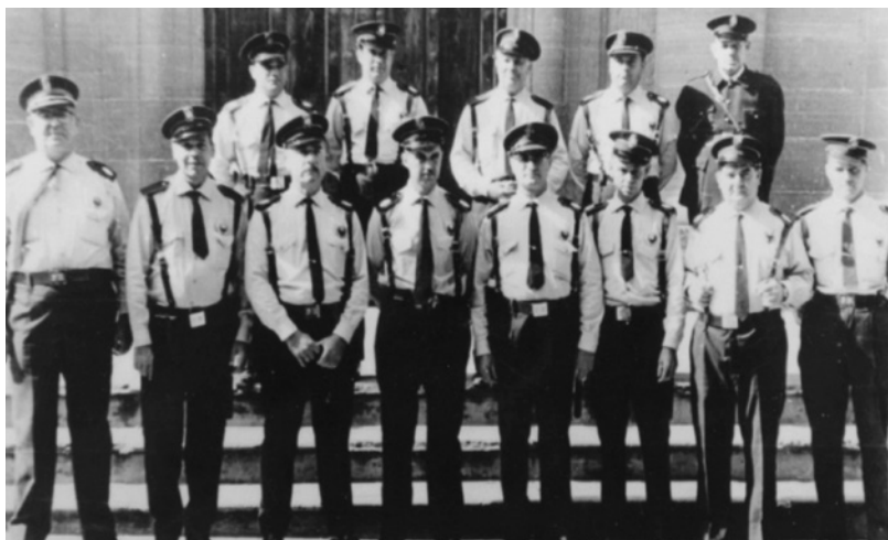
Componentes de la Policía Municipal en el frontis de la iglesia

Como aumentaban los problemas de convivencia y circulación con las consiguientes diferencias de criterios entre vecinos y la Guardia Municipal en la forma de solucionarlos. Los constantes enfados de ciudadanos por la forma arbitraria de aclarar las situaciones conflictivas, que dependía del criterio personal de la autoridad encargada de solucionarlos. Hizo que la Corporación acordara la creación de unas Reglas de Policía Urbana que se concretaron en 32 reglas que debían observar y cumplir todos los habitantes del municipio. Al mismo tiempo, se le indica las funciones que deberían realizar los Guardias Municipales.