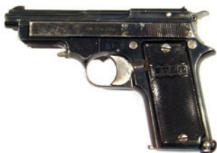
Pistola Star de 1919