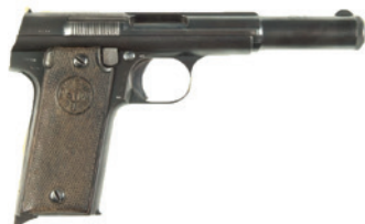
Pistola Astra de 1921