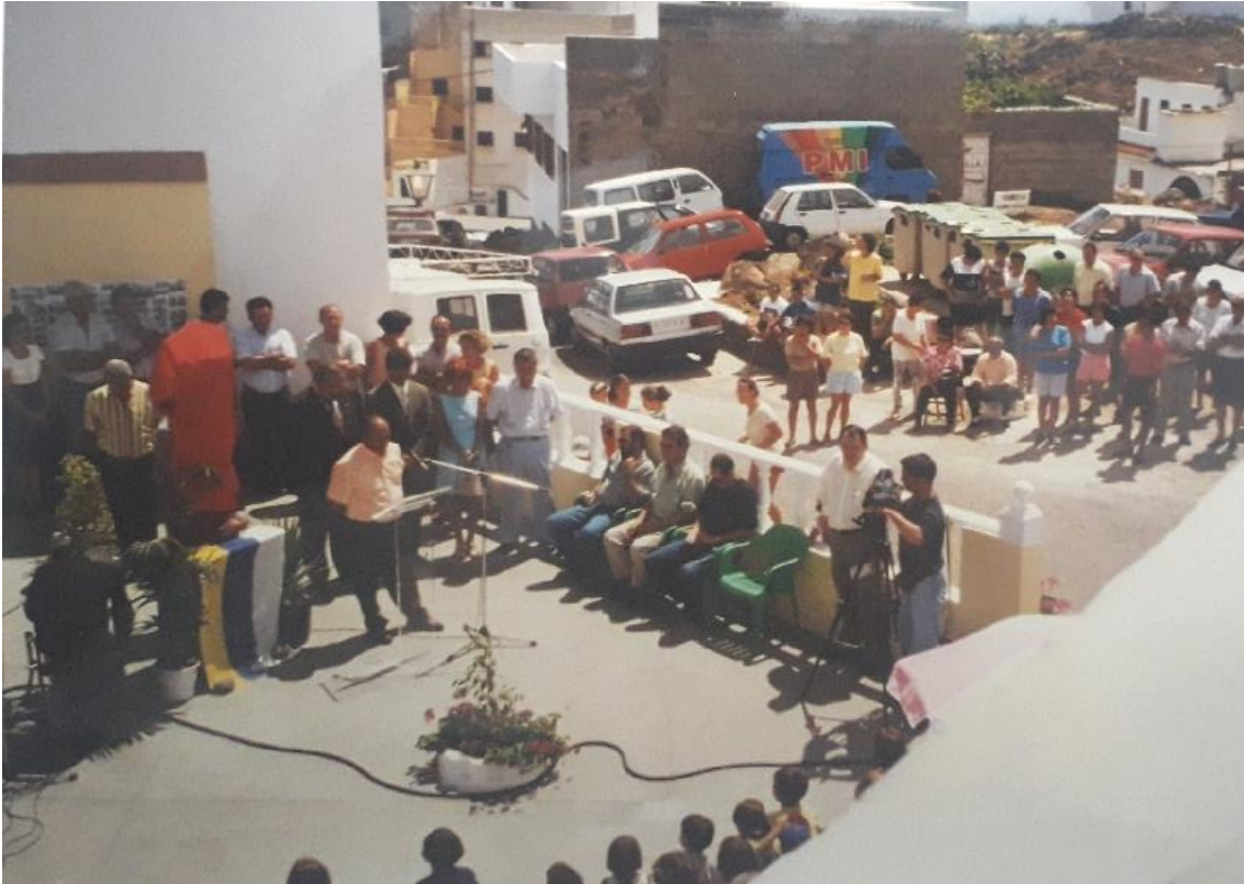
Momento de la inauguración del Mirador del Pescador y de la escultura Mujer Pescadora. Julio de 1997.