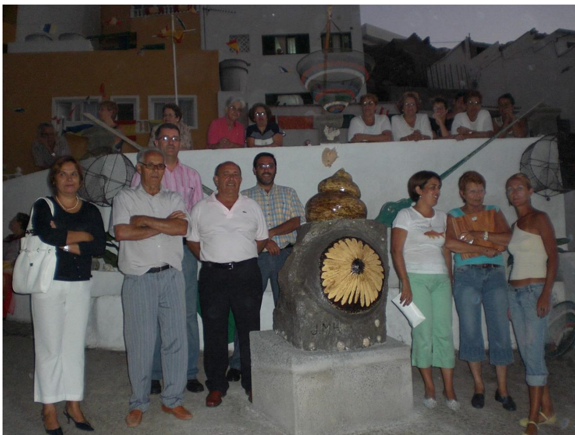
Momento de la Inauguración de Marisqueo . Agosto de 2008.

Cuatro años más tarde, durante la celebración de las fiestas del barrio, en el espacio dedicado a Domingo Macías, será inaugurada la escultura denominada Marisqueo (2008). Su autor, Juan Miguel Molina Hernández, quiso vincular en una sola pieza, a la actividad pesquera más cercana a la orilla, donde diferentes moluscos son la principal baza de captura marina, por lo que no es extraño que las dos alegorías de la escultura sean un burgado ( Osilinus atratus ) que corona la pieza, así como una gran lapa ( Patella piperata ) 10 , situada en la peana, realizada sobre una gran piedra traída para su ejecución, desde el también barrio pesquero de Los Dos Roques.