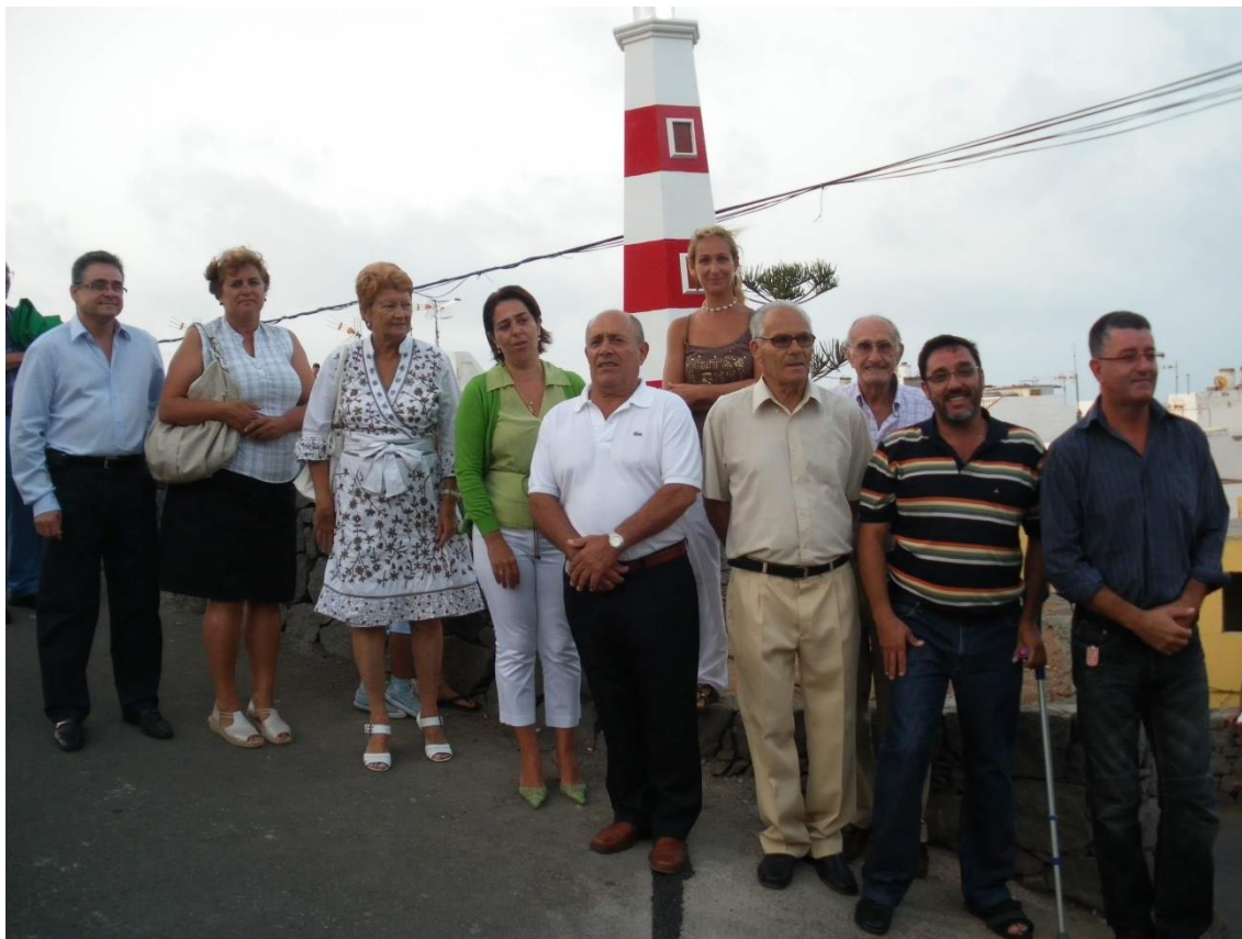
Momento de la Inauguración de El Faro . Agosto de 2009.

'faro', por tener luz propia en movimiento dentro de su linterna, marcando una peculiaridad respecto al resto de obras presentes en el paisaje caletero.