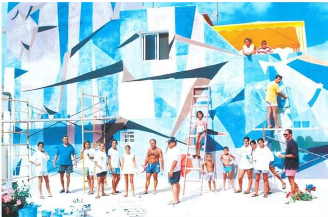
Realización del mural El Rayo Verde en agosto de 1997.

Este gran mural compartió espacio hasta aproximadamente el año 2005 con otra pieza escultórica de Juan Borges Linares, titulada Mujer Pescadora (1997) 6 . Esta escultura de bulto redondo financiada por el Club de Leones de Gáldar y la propia Asociación de Vecinos Nuestra Señora del Mar de Caleta Arriba, estaba realizada en yeso y representaba a una mujer canaria, pese a que en la lápida inaugural situada en el pedestal de la escultura figuraba la siguiente inscripción: