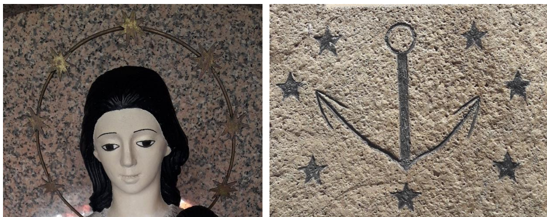
(Izq.) Detalle de la corona estrellada de Nuestra Señora del Mar y (Dcha.) detalle de la peana de la escultura El Pulpo , donde aparece tallado el anagrama del barrio inspirado en el mar y en la virgen.

del mismo, regida por el ancla (símbolo de la mar) y rodeado de siete estrellas (símbolo de la Virgen), haciendo una explícita referencia a que es el barrio el principal propietario de la pieza, como manera de reforzar los lazos entre la vecindad y su patrimonio.