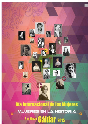
Cartel 8 M de 2015

Además de todo esto, la temática en torno al 8 de marzo del año 2015 giró en torno al papel de las mujeres en la historia.