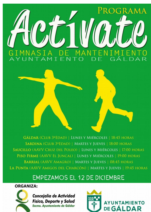
Ejemplo de cartel de actividades deportivas

Según la información obtenida, no podemos decir que se hayan realizado acciones específicas para cumplir estas medidas. En entrevista personal, informan que sí que se han cuidado las imágenes que se emplean en la cartelería del área, así como el lenguaje empleado, y por ejemplo, los carteles de los vestuarios se revisaron para ser más inclusivos.